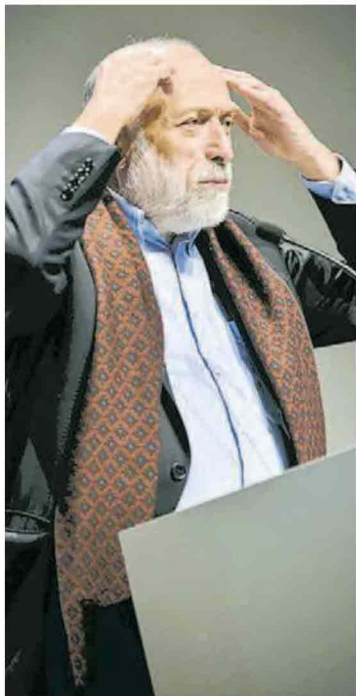
“Carlin”. “Un provinciale come me”